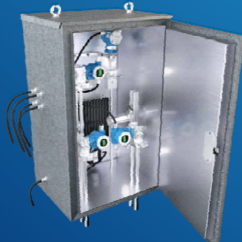
Термошкаф классического раскрытия РизурБокс-М-РК