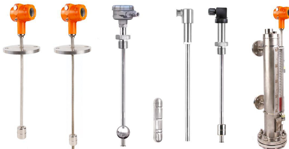
Рисунок 3 – Общий вид уровнемеров

Цвет корпуса и его элементов может отличаться от цвета, приведенного на рисунке 3.