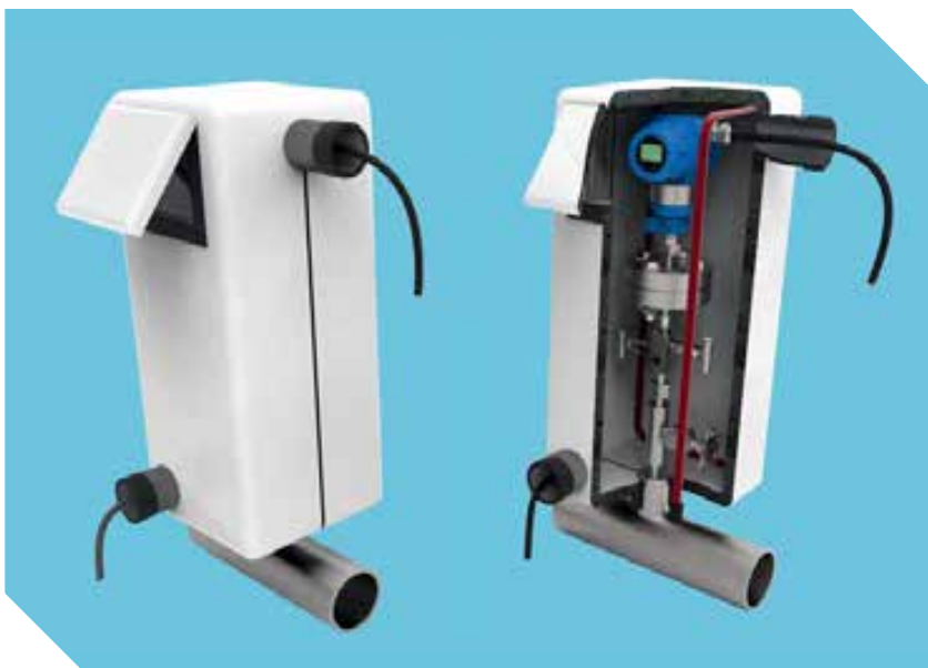
Термочехол РИЗУР для датчика давления с двухвентильным блоком и разделительной мембраной