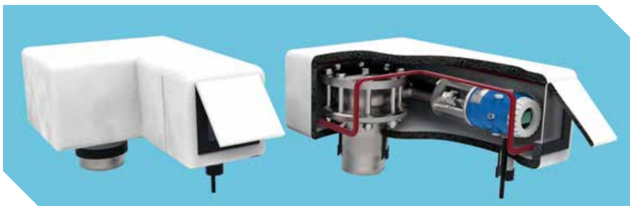
Термочехол РИЗУР для буйкового уровнемера